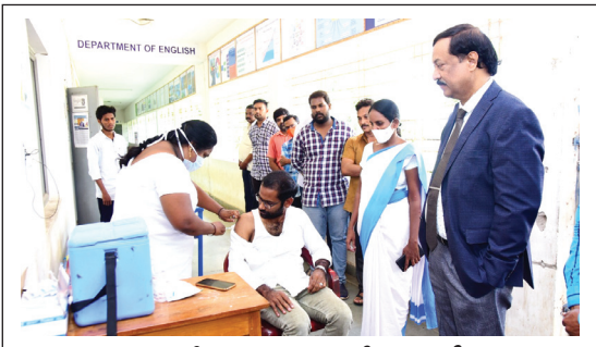
వ్యాక్సినేషన్ ప్రక్రియను పరిశీలిస్తున్న వీసీ