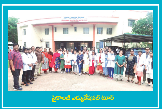
స్ట్రీకాలజీ ఎడ్యుకేషనల్ టూర్