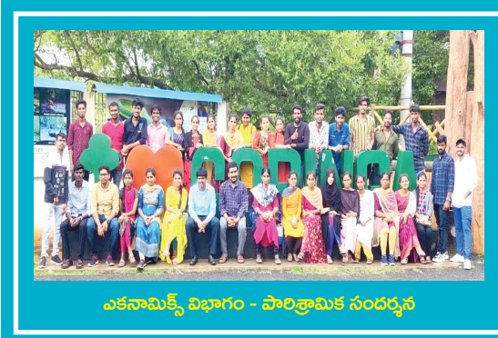
ఎకనామిక్స్ విభాగం - పారిశ్రామిక సందర్శన